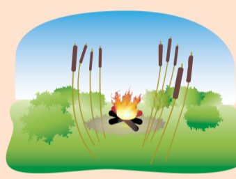
В зарослях сухого камыша