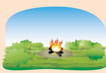
На торфяном болоте