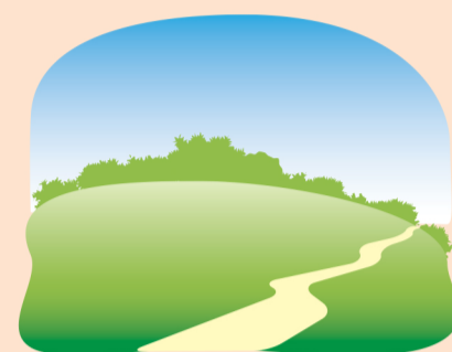
Найдите поляну, защищенную от ветра