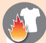
Приближаться к синтетической одежде