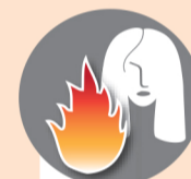
Находиться у костра с распущенными волосами