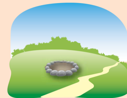
Очистите место от сухой травы и листьев, (зимой — от снега), обложите камнями