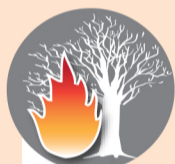
Поджигать сухое стоящее дерево