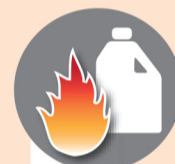
Лить в костер горючие жидкости