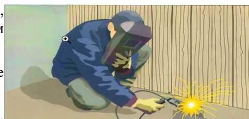
Нарушение правил проведения сварочных работ