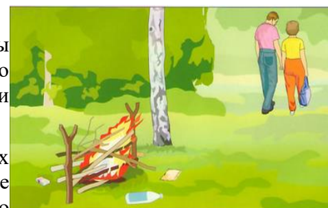
Разведение костров, поджигание сухой травы (палы)

· на территории жилых домов, дачных и садовых поселков, общественных и гражданских зданий не разрешается оставлять на открытых площадках и во дворах тару (емкости, канистры и т. п.) с легковоспламеняющимися жидкостями и горючими жидкостями, а также баллоны со сжатыми и сжиженными газами;