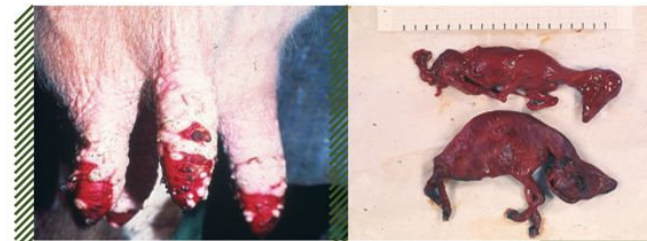
Экстенсивное сливное изъязвление кожи соска вымени у КРС