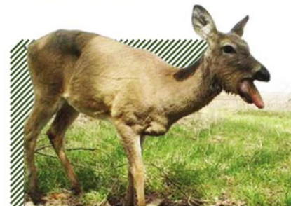
Отечность слизистых оболочек ротовой полости и языка