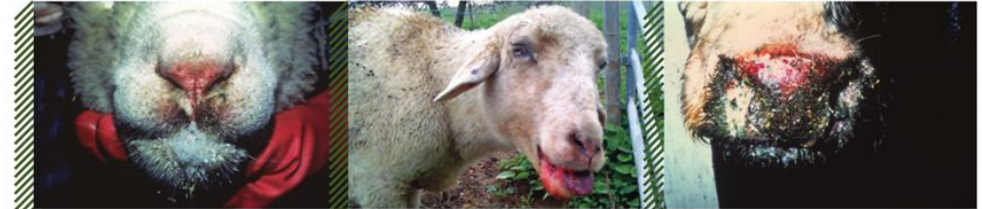
Эрозии крыльев носа и слонотечение у МРС